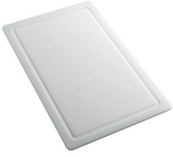
HPDE 砧板 8657 001