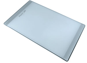
玻璃砧板 8631 300