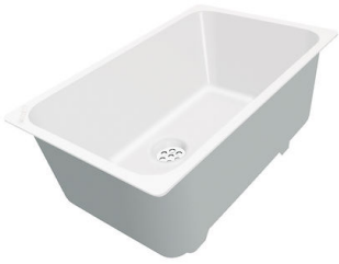
白托盘 8153 100